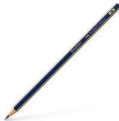
Black sketch pen